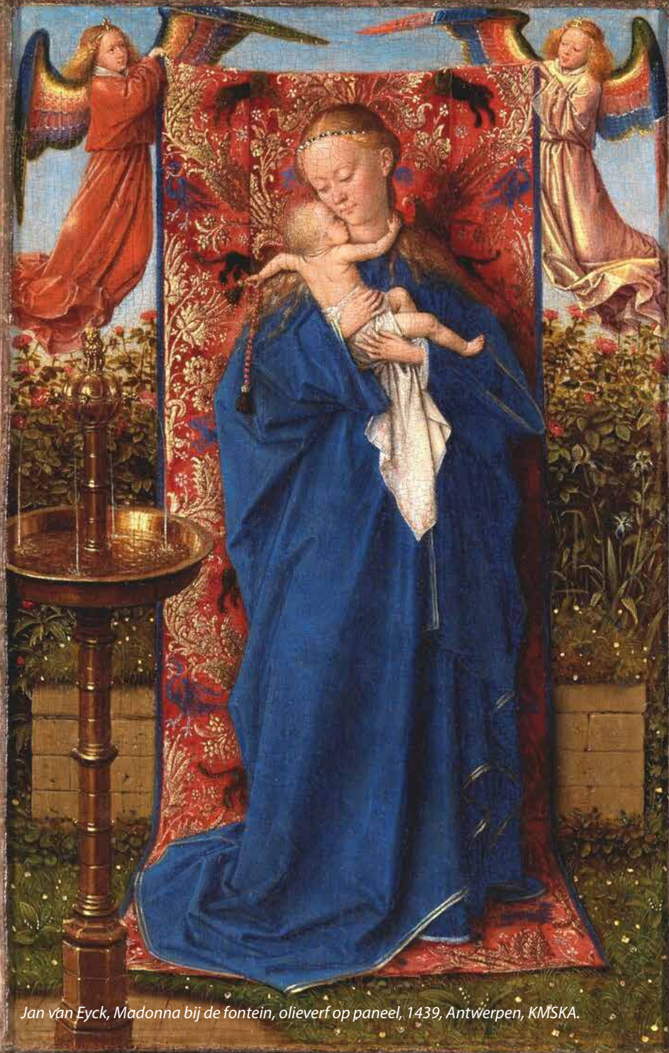
Jan van Eyck, Madonna bij de fontein , olieverf op paneel, 1439, Antwerpen, KMSKA.