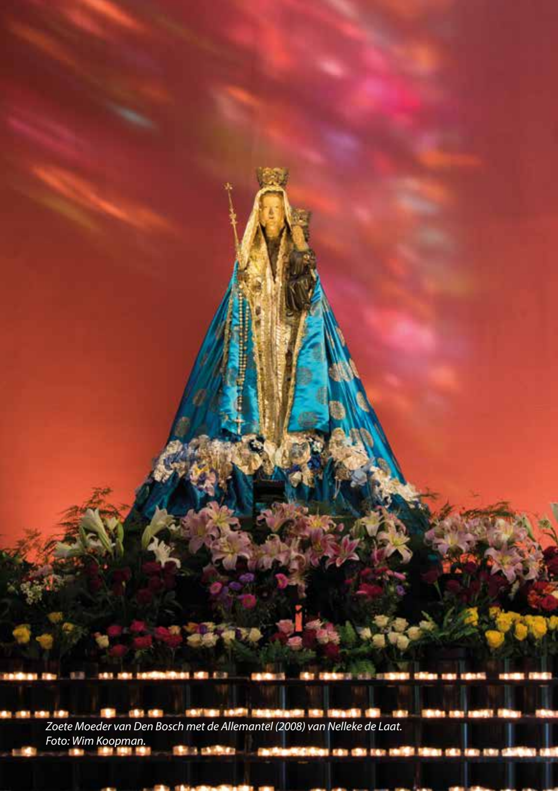
Zoete Moeder van Den Bosch met de Allemantel (2008) van Nelleke de Laat.