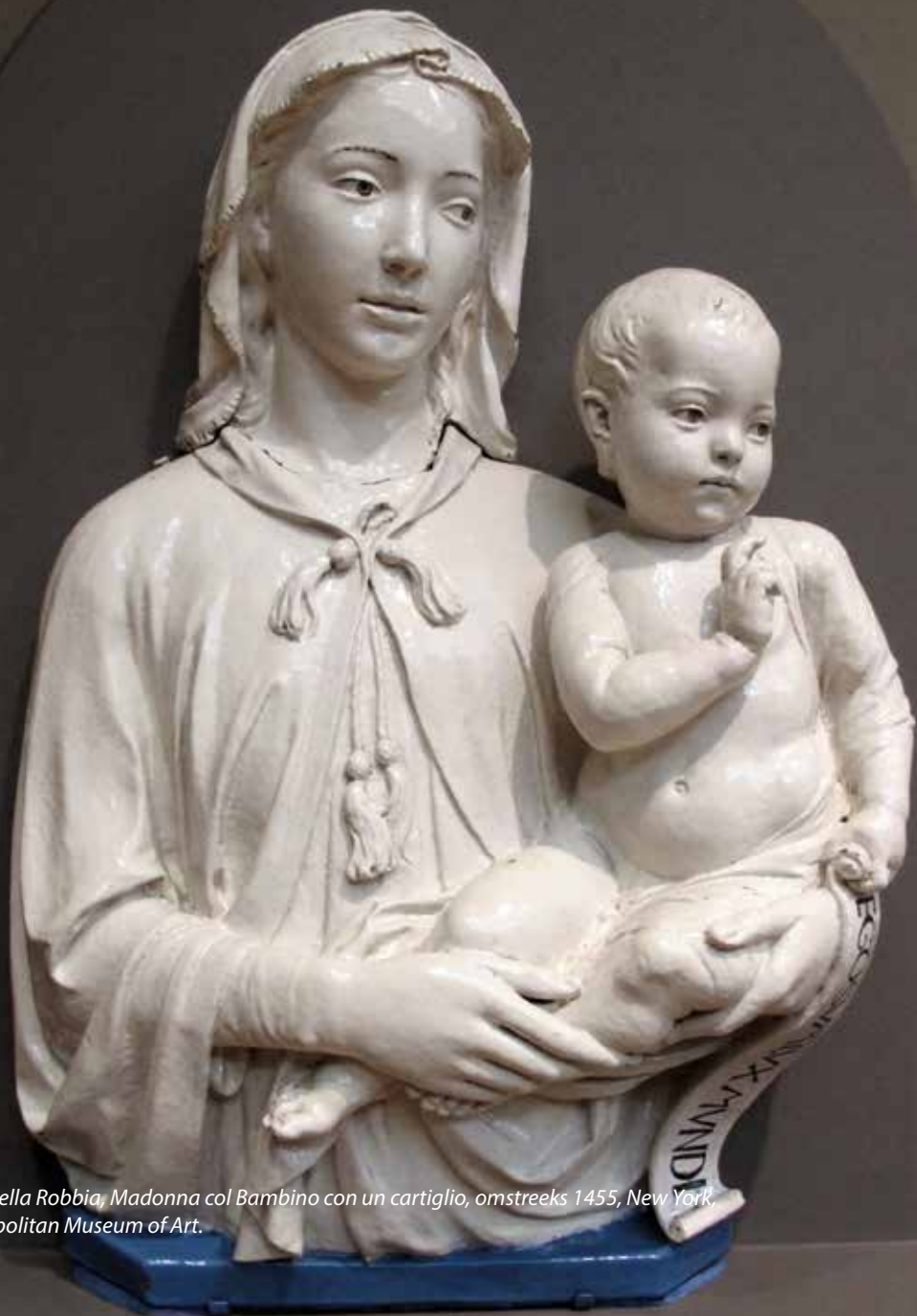
Luca della Robbia, Madonna col Bambino con un cartiglio, omstreeks 1455, New York, Metropolitan Museum of Art.