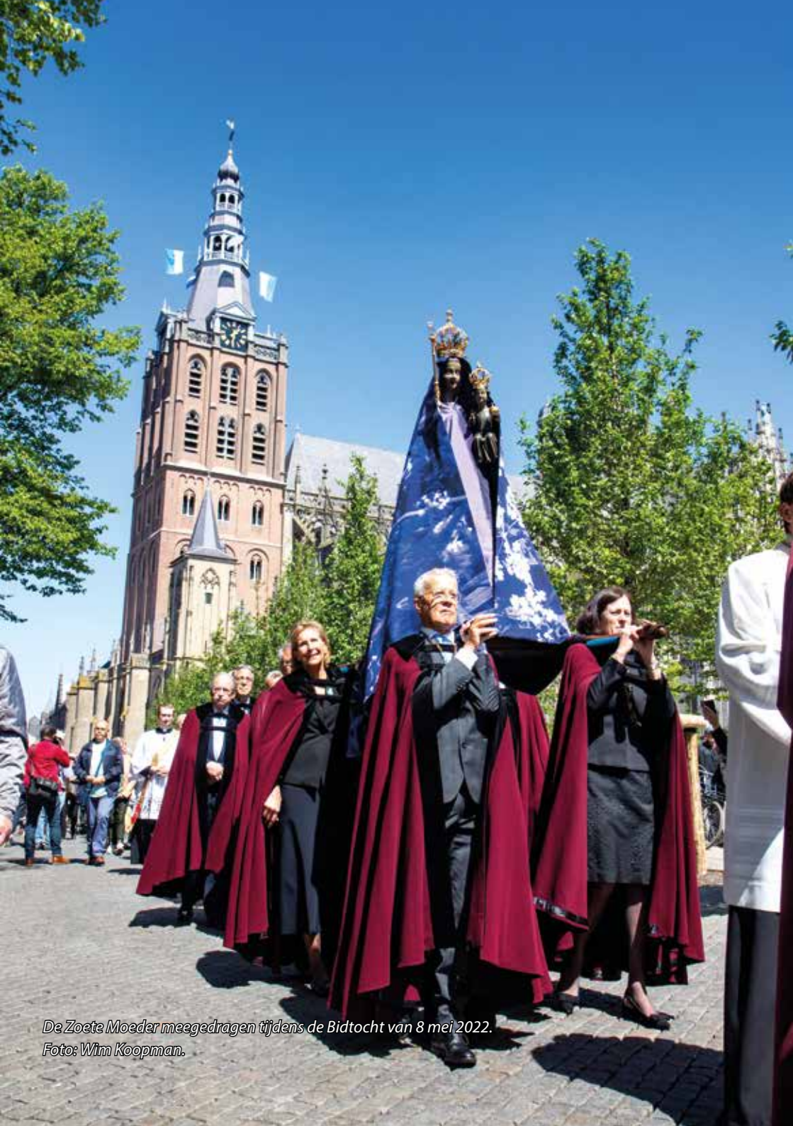
De Zoete Moeder meegedragen tijdens de Bidtocht van 8 mei 2022.