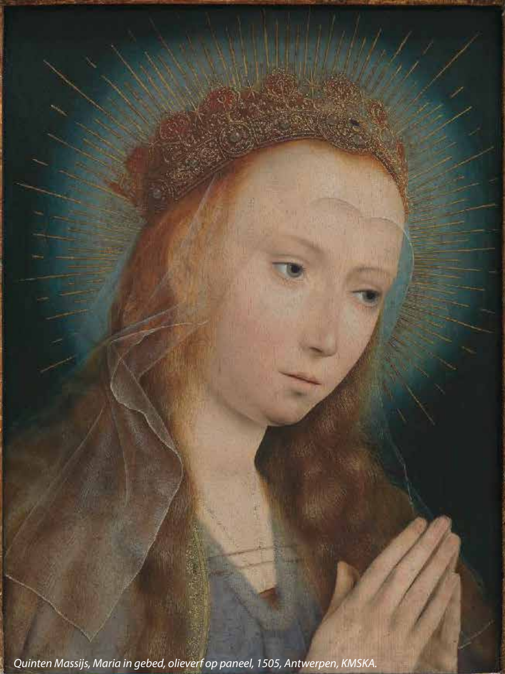
Quinten Massijs, Maria in gebed , olieverf op paneel, 1505, Antwerpen, KMSKA.