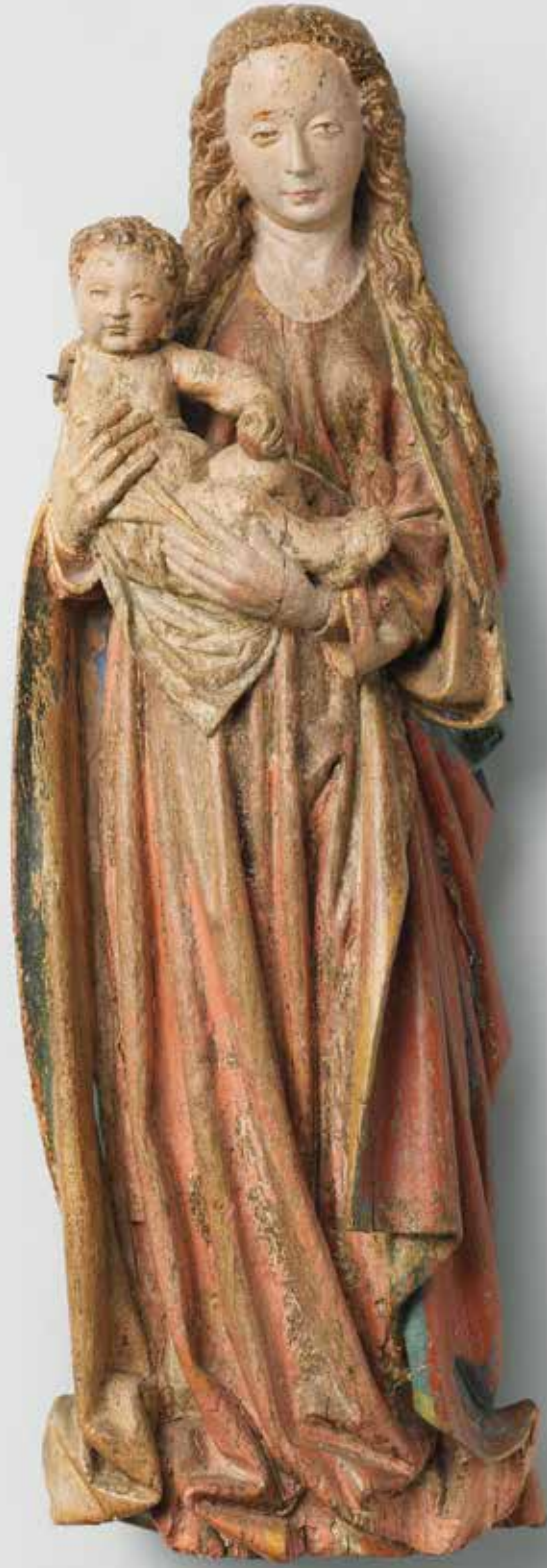
Borman werkplaats, Maria met Christus, eikenhout met polychromie, omstreeks 1490-1500, Amsterdam, Rijksmuseum.